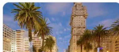
Centro de Montevideo