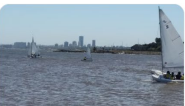
Rambla de Montevideo