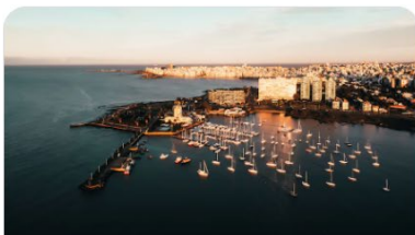
Puerto de Montevideo