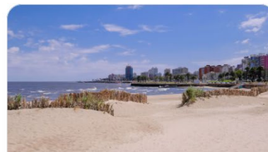
Playa de Pocitos